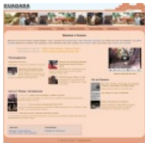
Le centre culturel Ouadada, Porto-Novo