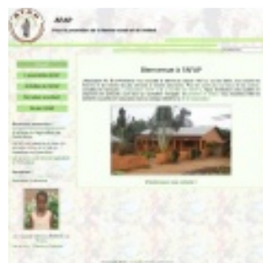
L'association AFAP, Porto-Novo