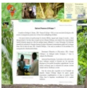
L'association Pomme d'Afrique, Porto-Novo