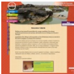
L'association Baština, France