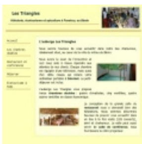
L'auberge Les Triangles, Parakou

Vous trouverez un aperçu de mes réalisations sur ma page Web :