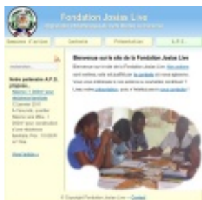
La fondation Josias Live, Cameroun