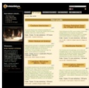
L'agence de voyage Point-Afrique Bénin, Cotonou